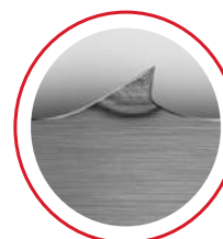
Carbon Säge HORN